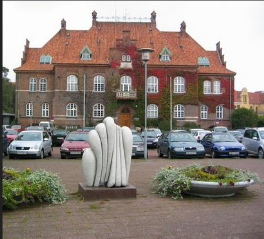
Foran Rådhuset i Holbæk