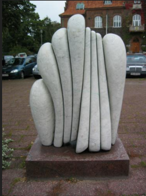
Danske Banks hovedsæde i København